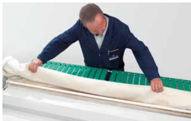
Un rivestitore di mangani Schulthess all'opera

I mangani che si trovano in perfette condizioni d'uso contribuiscono a farvi risparmiare denaro, poiché la biancheria viene trattata con delicatezza e può così mantenersi integra più a lungo. Il mangano conserva inoltre la propria efficacia e, con la nostra formula di abbonamento, potrete anche garantirne il funzionamento ininterrotto.