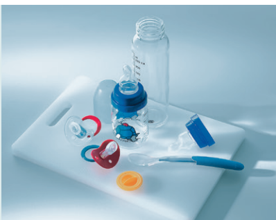
«Intensiv 70°C» für grösstmögliche Reinigung.